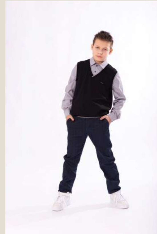
Джемпер для мальчика Модель ДТ-4221-Ш22 вискоза 73%, ПА 22%, спандекс 5% 72-84/152-176