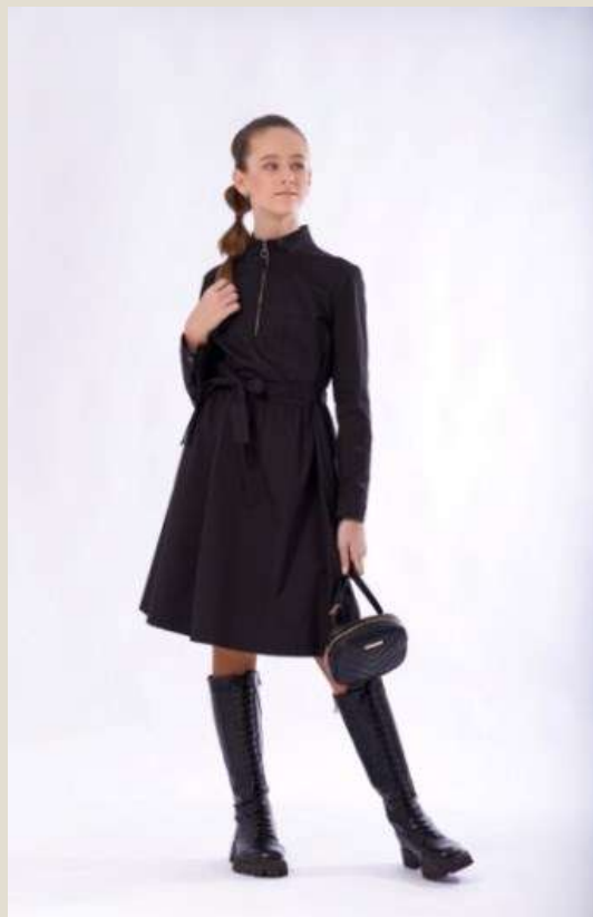
Платье для девочки Модель ДХ-4305-Ш22 Хлопок 100% 80-88/152-170