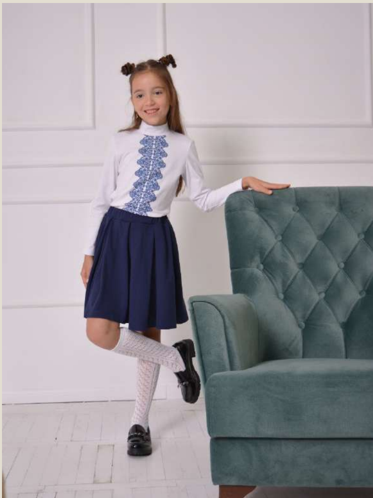
Джемпер для девочки Модель 794506 хлопок 92%, ПУ 8% 60-76 / 122-152 Цена: 15,0 BYN без НДС