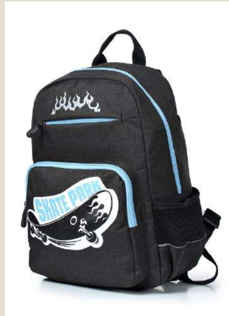
Рюкзак для учащихся начальных классов Модель 46021 ПЭ Цена: 57,00 BYN без НДС