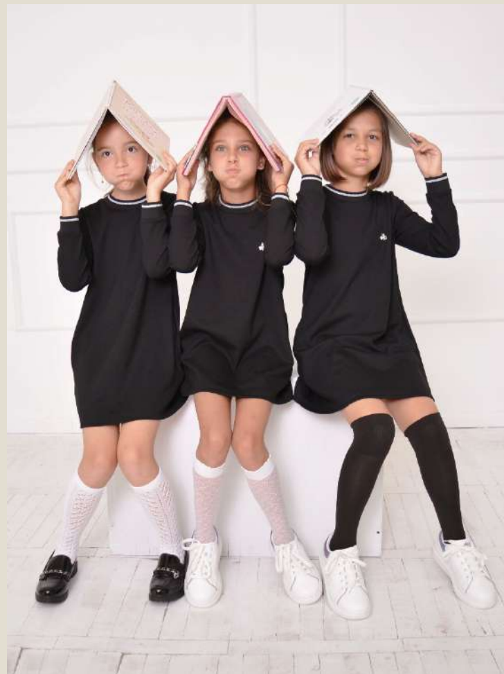
Платье для девочки Модель 818101 хлопок 75%, ПЭ 20%, ПУ 5% 60-76 / 122-152 Цена: 15,0 BYN без НДС