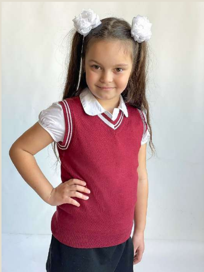
Жилет для девочки Модель 8841/8844 Хлопок 50%, ПАН 50% 60-72/122-146 76-88/152,164 Цена: 19,50-21,50 BYN без НДС