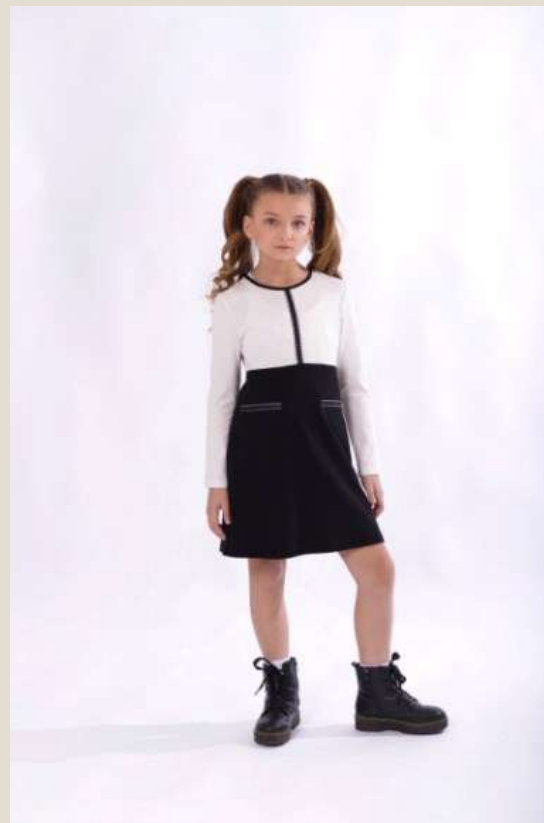
Платье для девочки Модель ДТ-4523-Ш22 вискоза 73%, ПА 22%, спандекс 5% 60-76/122-152