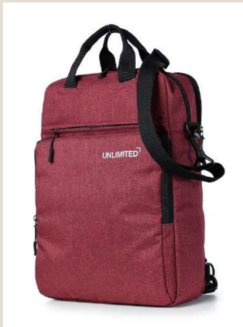
Рюкзак для учащихся средних/старших классов Модель 46421 ПЭ Цена: 65,4 BYN без НДС