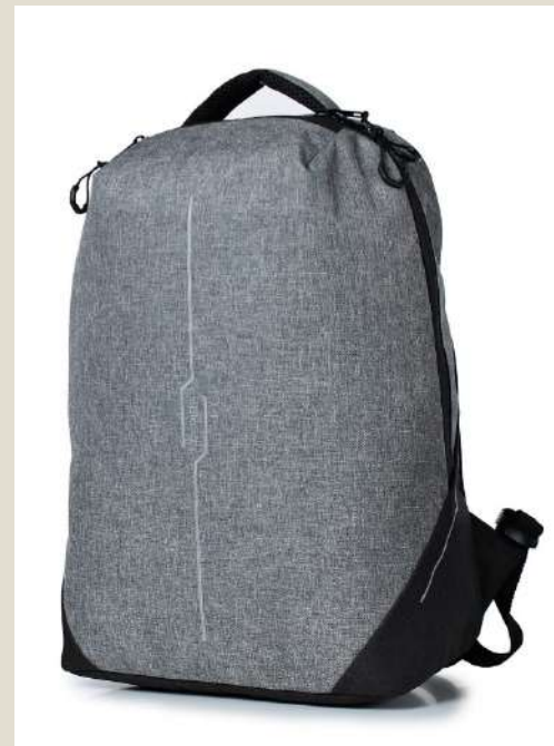
Рюкзак для учащихся начальных классов Модель 51021 ПЭ Цена: 53,00 BYN без НДС