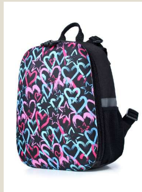
Рюкзак для учащихся начальных классов Модель 51021 ПЭ Цена: 53,00 BYN без НДС