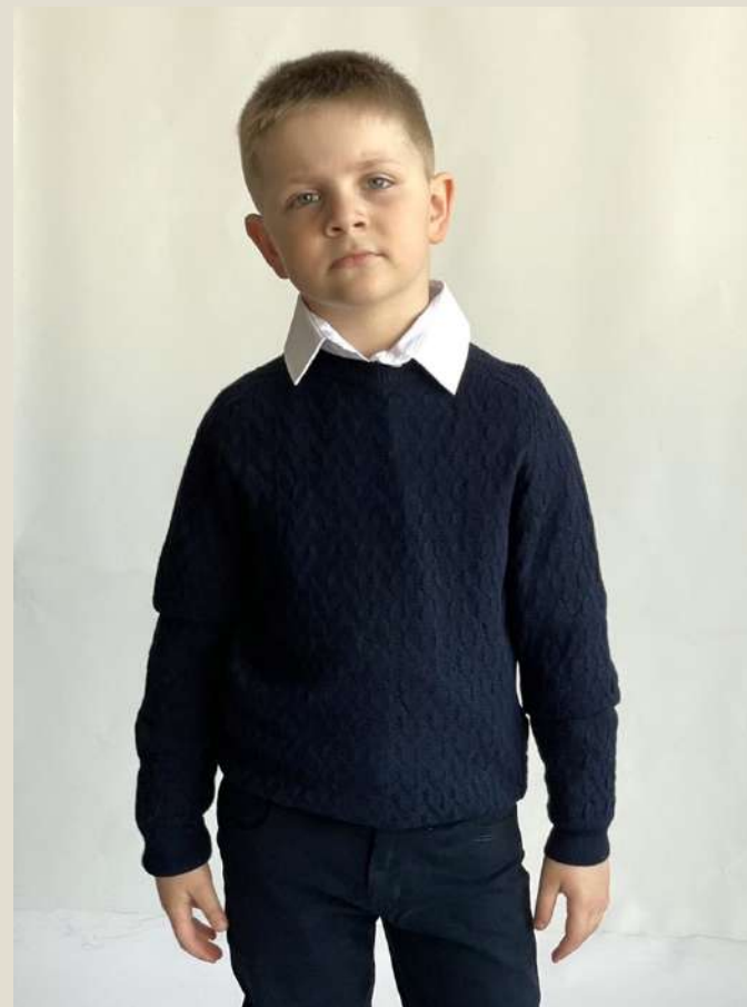
Джемпер для мальчика Модель 8845 Хлопок 50%, ПАН 50% 60-72/122-146 Цена: 28,00 BYN без НДС