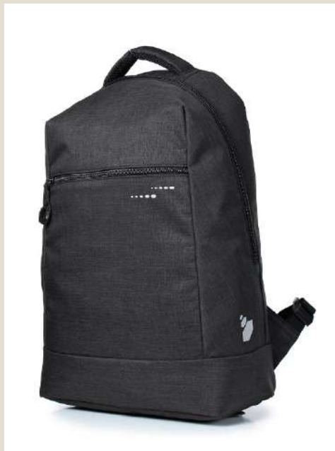
Рюкзак для учащихся средних/старших классов Модель 45621 ПЭ Цена: 50,00 BYN без НДС