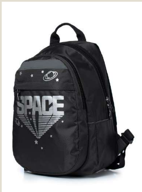
Рюкзак для учащихся начальных классов Модель 50921 ПЭ Цена: 54,00 BYN без НДС