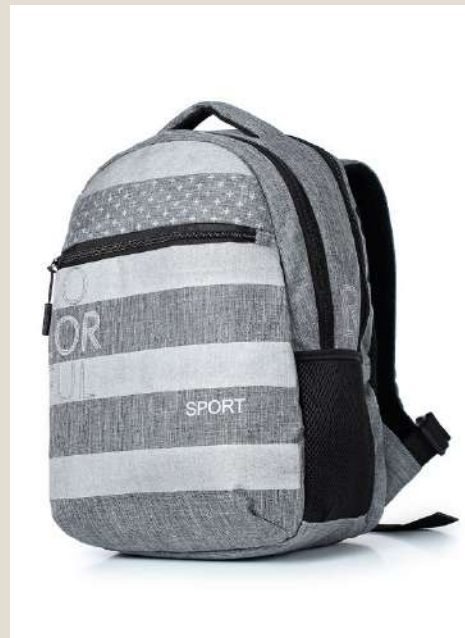
Рюкзак для учащихся средних/старших классов Модель 45291 ПЭ Цена: 75,00 BYN без НДС