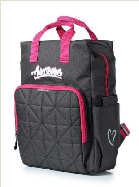
Рюкзак для учащихся средних/старших классов Модель 44621 ПЭ Цена: 88,00 BYN без НДС